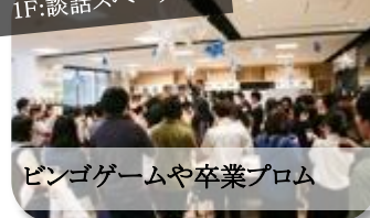
◀今回の b-lab の使い 方は中高生が中心とな って考えました