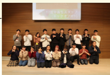
【17期中高生スタッフ】

中高生スタッフとは、b-labで「こんなことやってみたい!」を実現しようと様々な活動をする中高生や、「b-labをもっとこうしたい!」「b-labでこんなことができたらいいのに!」という思いをもとに、この施設の運営に関わる中高生です。1期の活動期間は約3か月で、スタッフを相談しながら具体的にどんな活動をしていくかを決めていきます。