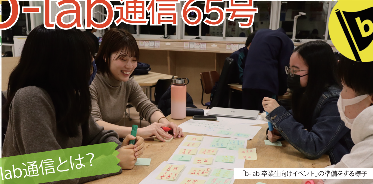
「b-lab 卒業生向けイベント」の準備をする様子