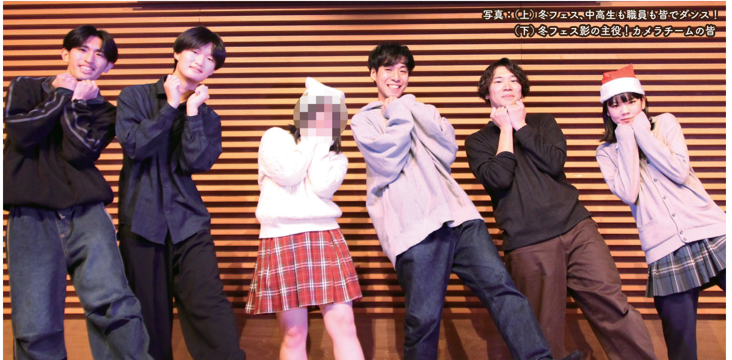
写真：(上)冬フェス、中高生も職員も皆でダンス！ (下)冬フェス影の主演！カメラチームの皆

中高生向け施設「文京区青少年プラザ (b-lab)」の運営や、活動をお知らせするため、区内の中学校・高等学校等の教職員の皆様及び b-lab にご協力頂いている方々に向けて発信する広報誌です。