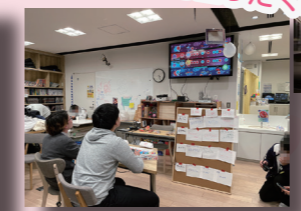
(写真は冬フェスの様子)