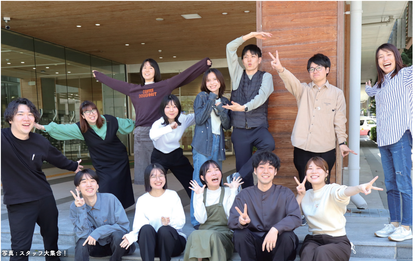
写真：スタッフ大集合！

中高生向け施設「文京区青少年プラザ (b-lab)」の運営や、活動をお知らせするため、区内の中学校・高等学校等の教職員の皆様及び b-lab にご協力頂いている方々に向けて発信する広報誌です。