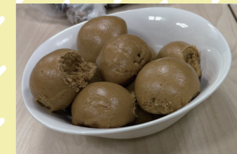
↑イベントで作ったおまんじゅう